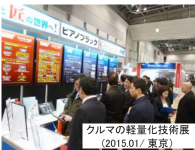
クルマの軽量化技術展 (2015.01/東京)

お近くにお越しの際は、弊社ブースにお立ち寄り賜りますよう宜しくお願い 致します。